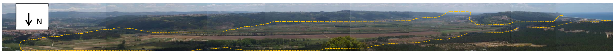
Figura 2 - Observação da lagoa no Monte de São Bartolomeu.