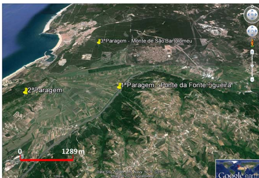
Figura 1 - Localização dos pontos de observação na atividade prática de campo. Imagem obtida a partir do Google Earth®.